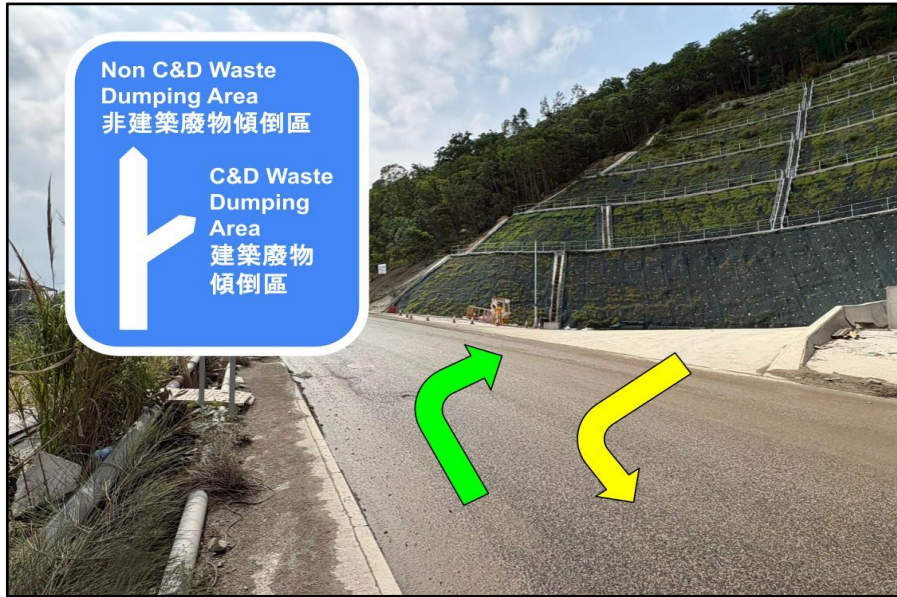
入口 (Entrance) : 請向 右轉 (turn right) 進入